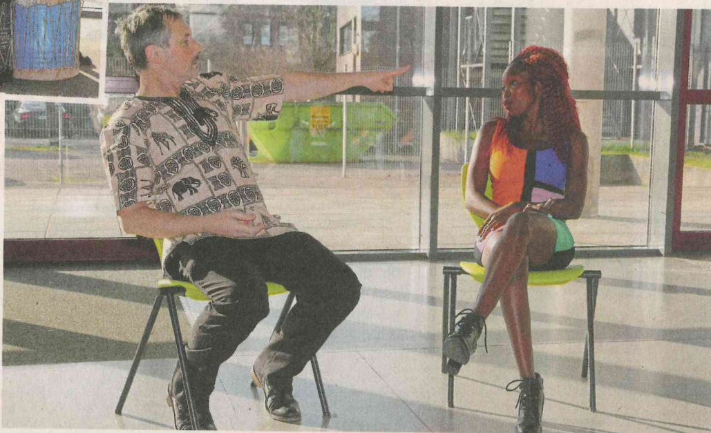
Als seine afrikanische Freundin ihm von ihrer Schwangerschaft erzählt, fragt der Schokoladenfabrikant erstmal ganz scheinheilig, wer denn wohl der Vater des Kindes sei.